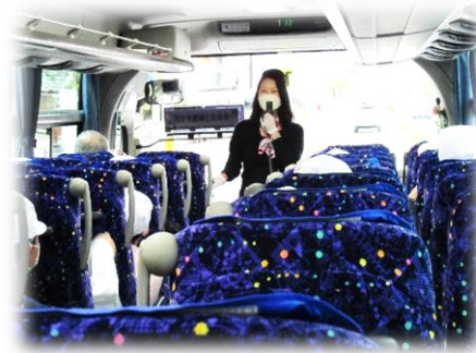
消毒と車内換気の効いたバス