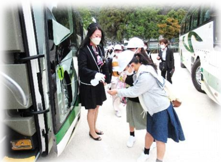
バスに乗るたびに消毒