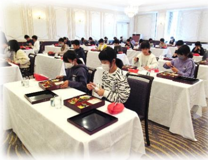
スクール形式での食事 黙食の徹底